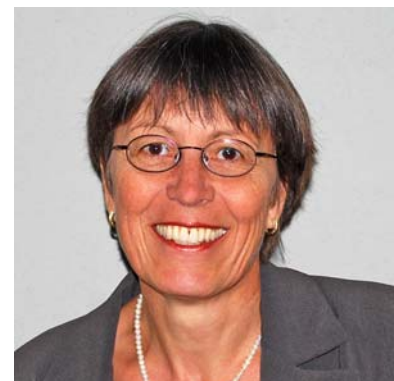
Bereichsleiterin 3. - 5. Klassen