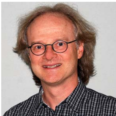
Bereichsleiter 1. - 2. Klassen