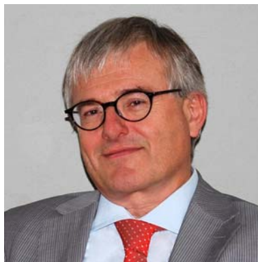
Rektor Bereichsleiter 6. Klassen