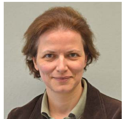
Bereichsleiterin 3. - 5. Klassen